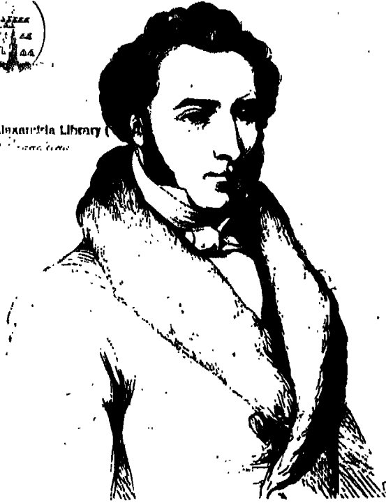
مارشان، خادم الامبراطور

بمطبعة الإسكندرية